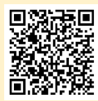
「ラーケーションの日」活動例